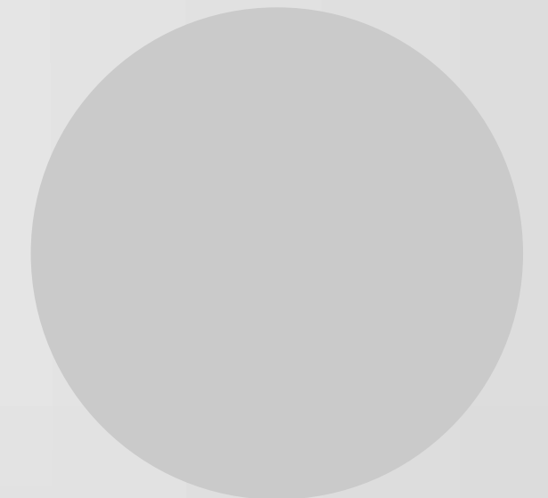
En reclutamiento Desarrollo Jr.